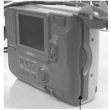
مكان كارت الذاكرة