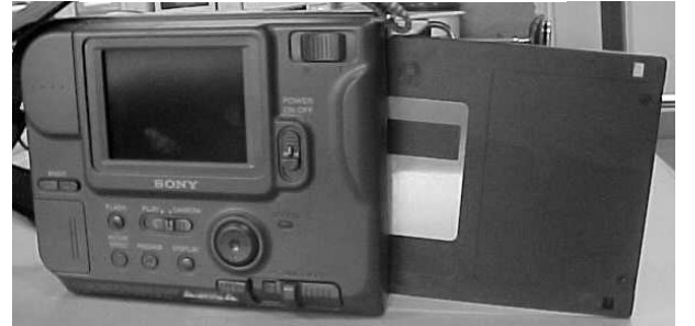
ادخل كارت الذاكرة برفق