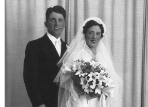
Fotografie de nuntă