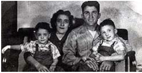
Familia mea: trecut, prezent și viitor