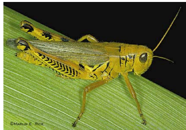
Broaștele mănâncă lăcuste.

A doua, când iei o broască, asigură-te că știi ce fel de broască e.