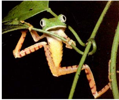
Broască de copac adultă