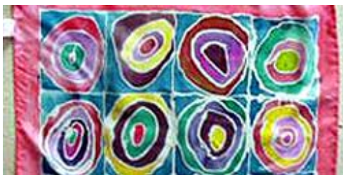
Mătasea vieții noastre