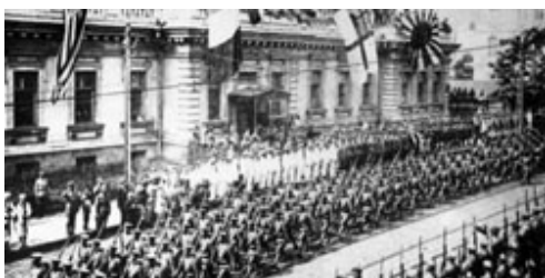
Primul Război Mondial