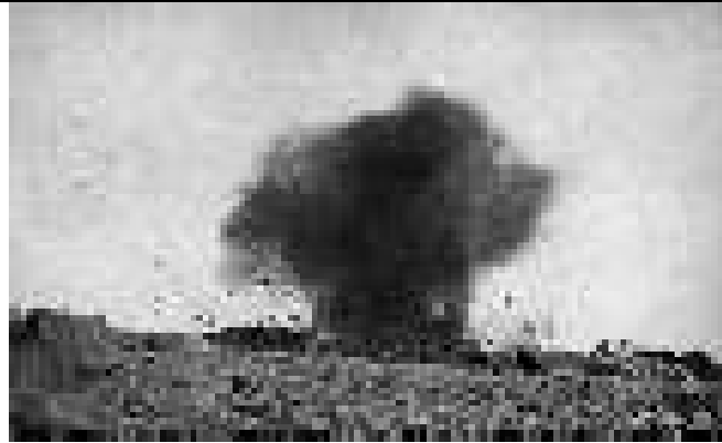
Explozia unui proiectil german lângă liniile britanice