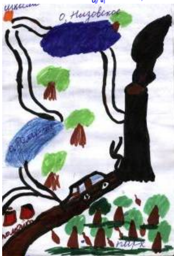
Схема экскурсии, отметки выявленных проблем

Что еще необходимо сделать, чтобы выполнить задуманное?