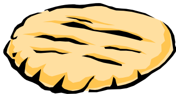
Um biscoito de açúcar inteiro