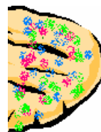
Uma metade decorada

Que maneira deliciosa de estudar as frações!