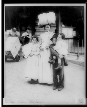
Otros inmigrantes del barco