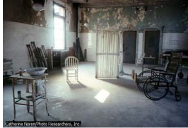
Zona para la inspección médica

Cuando finalmente llegó mi turno en la fila, fui inspeccionado por un oficial médico. No duró mucho. Escuché que le llamaban el “examen de los seis segundos” porque el inspector médico revisaba seis cosas: el cuero cabelludo, la cara, manos, cuello, el modo de andar y la condición general de salud. Luego, hicieron una inspección más detenida.